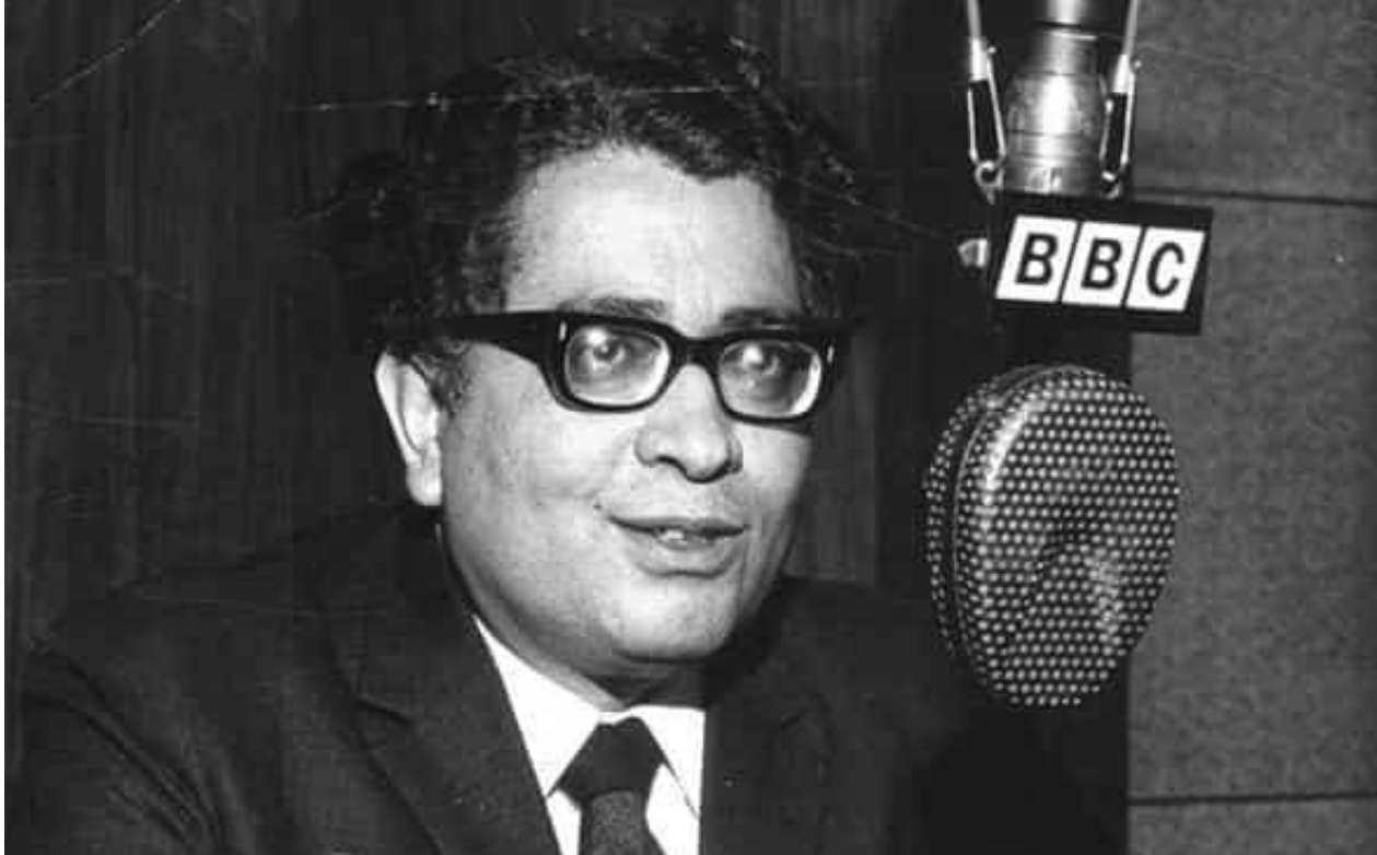
मोहन राकेश हिन्दी नाटक

छात्र चर्चा: आपकी राय में अधिक सम्मोहक क्या है - नाटक या सिनेमा?