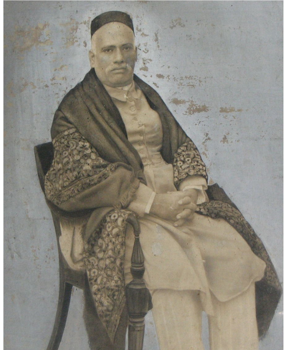
देवकी नंदन खत्री हिन्दी उपन्यास

छात्र चर्चा: क्या काल्पनिक साहित्य सिर्फ मनोरंजन के लिए है?